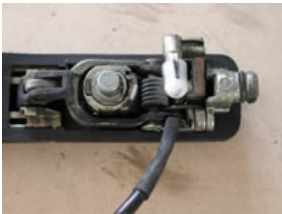
Einmal ganz, der kleine Hebel ist also noch dran:

Der kleine Hebel bricht leider gerne ab, wenn der Türgriff nicht öfters mal gepflegt wird